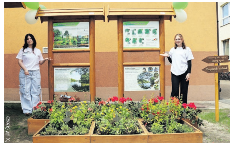
fol. UM Orzesze

WFOŚiGW w Katowicach od ponad 30 lat wspiera działania związane z edukacją ekologiczną dzieci i młodzieży, m.in. poprzez organizację warsztatów, konkursów, wspieranie ośrodków realizujących programy dla dzieci. Starając się dotrzeć jak najgłębiej do świadomości dziecka i zadbać w miarę możliwości o jego wiedzę nt. ochrony środowiska. A poprzez co najlepiej dotrzeć - jak nie przez szkoły!