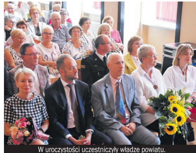
W uroczystości uczestniczyły władze powiatu.

W auli I LO im. Karola Miarki w Mikołowie odbyła się uroczystość zakończenia roku akademickiego Powiatowego Uniwersytetu Trzeciego Wieku. Uczelnia działa od 14 lat, a wśród obecnych na sali studentów byli tacy, którzy są z nią związani od samego początku.