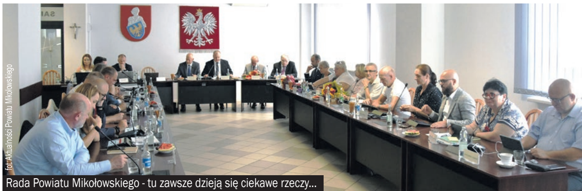
Rada Powiatu Mikołowskiego - tu zawsze dzieją się ciekawe rzeczy...