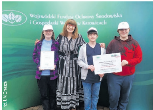
fol. UM Orzesze