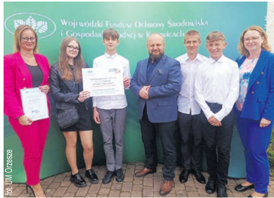
fol. UM Orzesze