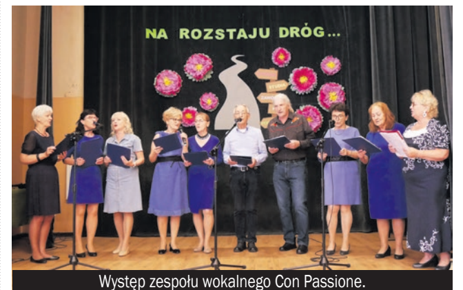
Występ zespołu wokalnego Con Passione.

Były podziękowania dla najaktywniejszych studentów oraz osób wspierających PUTW, zaś na zakończenie wystąpił uczelniany zespół wokalny Con Passione , grupa tańca liniowego Satysfakcja oraz licealiści z Miarki. Zapisy na kolejny rok zorganizowane zostaną od 9 do 11 września od 16.00 w I LO.