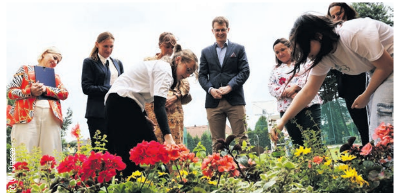
fol. UM Orzesze

Uczniowie Szkoły Podstawowej nr 5 im. Janusza Korczaka w Orzeszu Zazdrości mogą się cieszyć ze wspaniałego miejsca do nauki i spędzania czasu. Mowa o ekopracowni „Zakątek pod chmurami”.