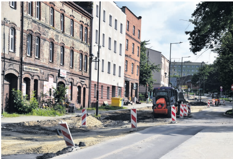
Jedną z dróg współfinansowanych z Rządowego Funduszu Rozwoju Dróg jest ul. Pszczyńska w Mikołowie.

► We wszystkich gminach naszego powiatu trwają remonty oraz przebudowy dróg powiatowych.