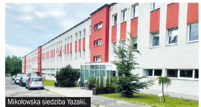
Mikołowska siedziba Yazaki.

a Unia Europejska - regulacji. W związku z polityką klimatyczną, Bruksela bombarduje ludzi i gospodarkę kolejnymi zakazami, nakazami, limitami, karami. Przestaje to przypominać wolny rynek i kapitalizm, a zamienia się w socjalistyczną gospodarkę planową. Gospodarcza niestabilność i wysokie ceny energii powodują, że wielki przemysł ucieka z Europy do krajów, gdzie nie obowiązują tak wysrubowane regulacje klimatyczne. To bardzo niebezpieczny trend. W skali globalnej spada konkurencyjność unijnej gospodarki, a jednocześnie rośnie jej uzależnienie od zewnętrznych dostawców.