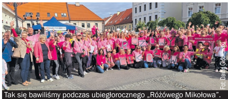
Tak się bawiliśmy podczas ubiegłorocznego „Różowego Mikołowa”.

19 października mikołowski Rynek znów stanie się różowy. Wszystko za sprawą piątej, jubileuszowej edycji wydarzenia związanego z profilaktyką zdrowotną „Różowy Mikołów”.