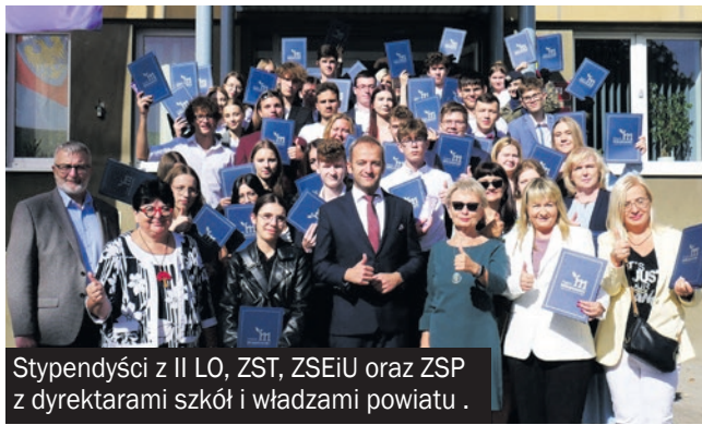
Stypendyści z II LO, ZST, ZSEiU oraz ZSP z dyrektarami szkół i władzami powiatu.

106 uczniów odebrało 25 września stypendia Starosty Mikołowskiego. Wyróżnienia te przyznawane są uczniom szkół ponadpodstawowych, dla których organem prowadzącym jest Powiat Mikołowski.