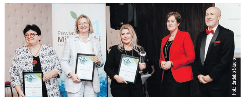
Laureatki w Kategorii Bizneswoman Roku wraz z członkami kapituły konkursu Diament Roku Powiatu Mikołowskiego.

■ Diament Roku Powiatu Mikołowskiego w Kategorii Osobowość Roku otrzymał zespół Paktofonika Live Band .