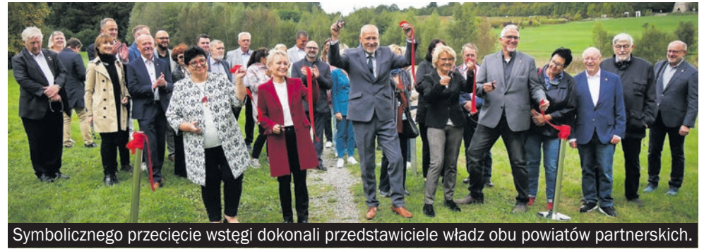
Symbolicznego przecięcie wstęgi dokonali przedstawiciele władz obu powiatów partnerskich.

Ważnym punktem wizyty było zorganizowane 27 września w CAS Mikołów Forum Współpracy Międzynarodowej Polsko-Niemieckiej. Wydarzenie to było adresowane do przedsiębiorców i przedstawicieli samorządów