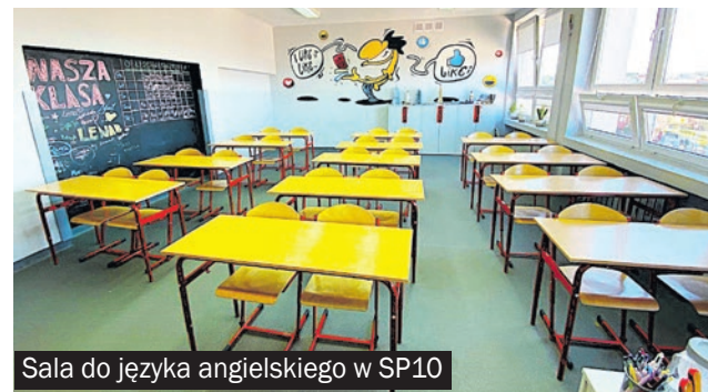
Sala do języka angielskiego w SP10