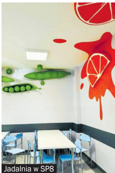
Jadalnia w SP8