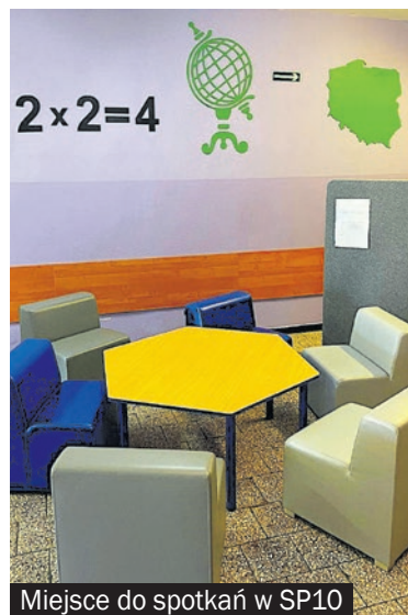
Miejsce do spotkań w SP10