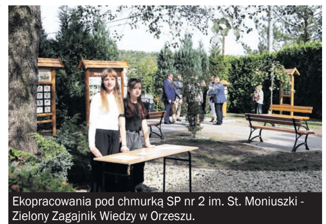
Ekopracownia pod chmurką SP nr 2 im. St. Moniuszki - Zielony Zagajnik Wiedzy w Orzeszu.

Dotacja będzie udzielana z uwzględnieniem efektów zadania i możliwości finansowych Funduszu do wysokości 80% kosztów kwalifikowanych z zastrzeżeniem, że maksymalna kwota dotacji nie może przekroczyć 70 000 zł. Wnioski w formie papierowej lub elektronicznej można składać w terminie od 1 kwietnia do 30 kwietnia 2025 r.