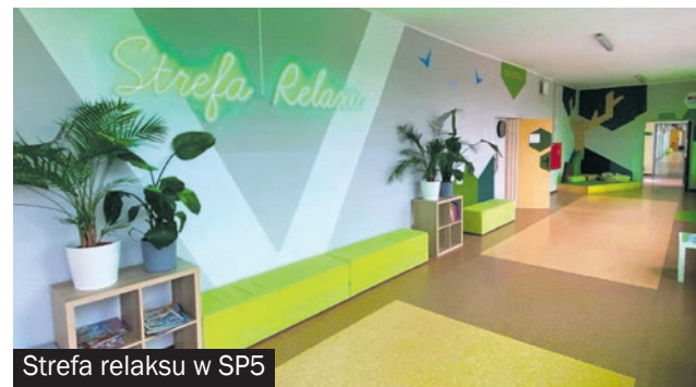
Strefa relaksu w SP5