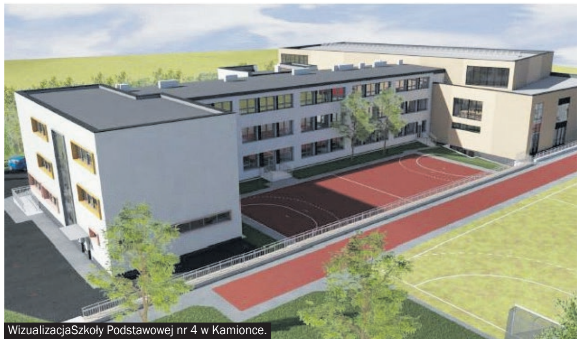
Wizualizacja Szkoły Podstawowej nr 4 w Kamionce.