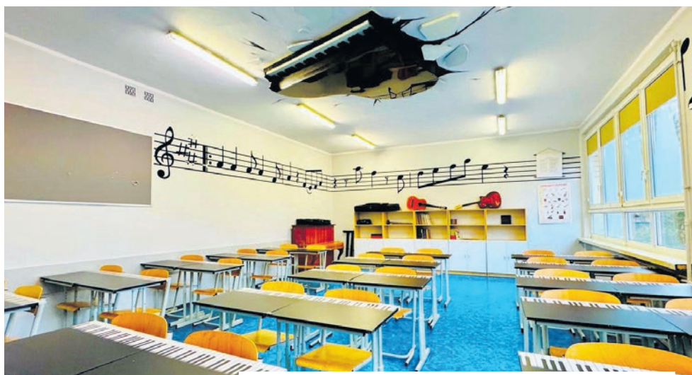
Sala muzyczna w SP5

Same sale lekcyjne również przeszły ogromną przemianę. Wygodne krzesła, zaawansowany sprzęt multimedialny oraz interaktywne tablice czynią naukę