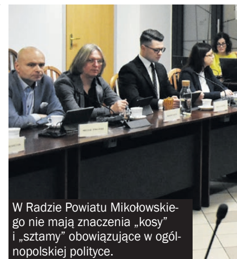
W Radzie Powiatu Mikołowskiego nie mają znaczenia „kosy” i „sztamy” obowiązujące w ogólnopolskiej polityce.

Na szczęble centralnym Donald Tusk skutecznie wciągnął do swojej antyPiSowej krucjaty Szymona Hołownię i lider Polski 2050 raczej nie ma już możliwości,