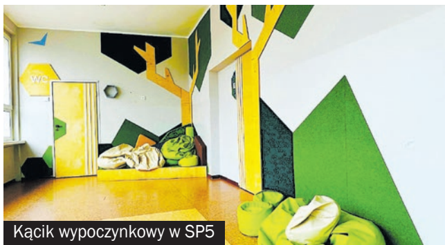
Kącik wypoczynkowy w SP5