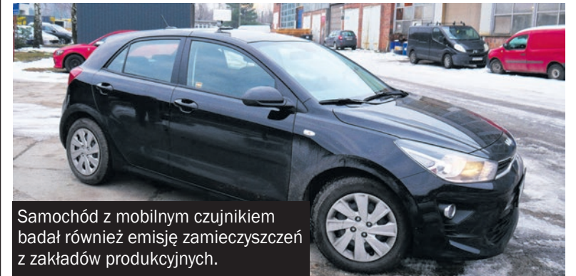
Samochód z mobilnym czujnikiem badał również emisję zamieci zanieczyszczeń z zakładów produkcyjnych.

Od ponad trzech tygodni w Powiecie Mikołowskim trwają pomiary jakości powietrza mobilnym czujnikiem typu „airly”. Dzięki tym pomiarom możliwe jest zebranie szczegółowych danych o jakości powietrza z gmin naszego powiatu.