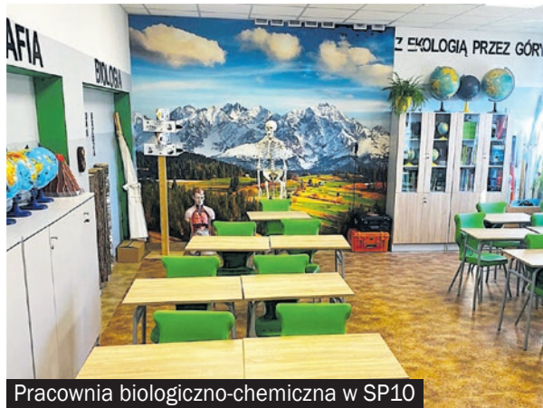
Pracownia biologiczno-chemiczna w SP10

Zmiany te sprawiły, że szkoła stała się miejscem przyjaznym i inspirującym. Uczniowie chętniej spędzają czas w jej murach, a przerwy nie przypominają już dawnych, hałaśliwych goniw.