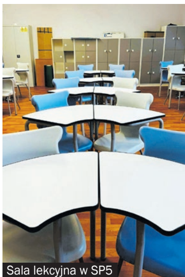
Sala lekcyjna w SP5