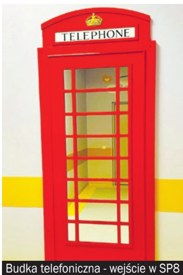
Budka telefoniczna - wejście w SP8