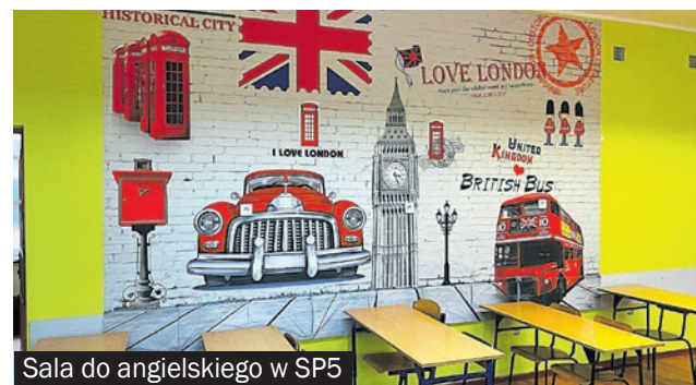
Sala do angielskiego w SP5

zna dla każdego. Niezmiennie będziemy inwestować w nasze placówki oświatowe.