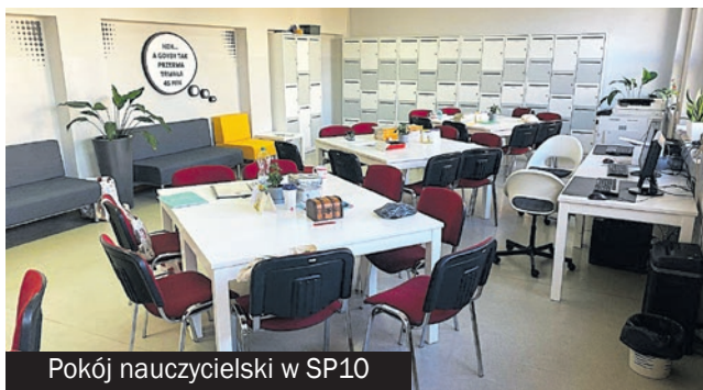
Pokój nauczycielski w SP10