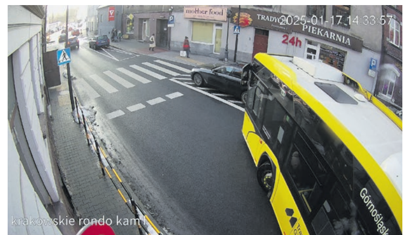
krakowskie rondo kam...