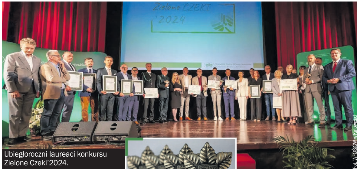
Ubiegłoroczni laureaci konkursu Zielone Czeki'2024.

► Wojewódzki Fundusz Ochrony Środowiska i Gospodarki Wodnej w Katowicach zaprasza do udziału w kolejnej edycji prestiżowego Konkursu Zielone Czeki.