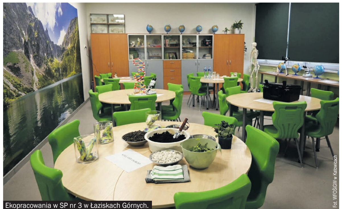
Ekopracowania w SP nr 3 w Łaziskach Górnych.

► Projekty dwóch ekopracowni z naszego powiatu zostały nagrodzone w 11. konkursie „Zielona Pracownia_Projekt” Wojewódzkiego Funduszu Ochrony Środowiska i Gospodarki Wodnej w Katowicach. Szkoła Podstawowa nr 5 im. J. Korczaka w Orzeszu-Zawiści dostała nagrodę w wysokości 11 982 zł, a SP nr 5 im. G. Morcinka w Mikołowie - 12 000 zł.