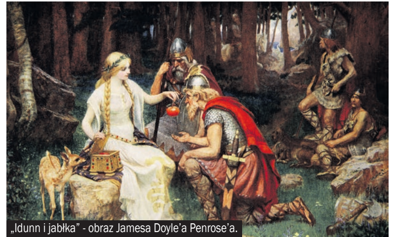
„Idunn i jabłka” - obraz Jamesa Doyle'a Penrose'a.

W przedchrześcijańskiej mitologii Słowian Południowych, zwłaszcza u Chorwatów, Serbów i Słowenów,