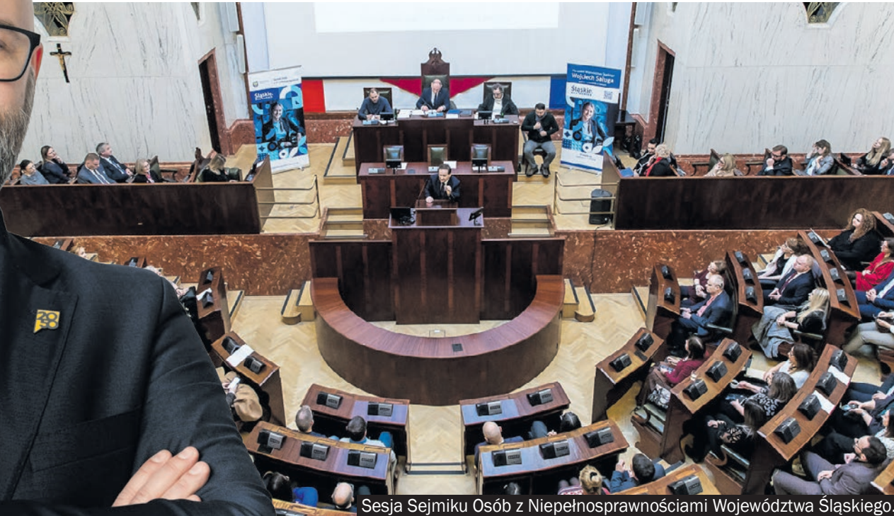
Sesja Sejmiku Osób z Niepełnosprawnościami Województwa Śląskiego.

- Jak Pan ocenia sytuację osób z niepełnosprawnościami w naszym powiecie i województwie?