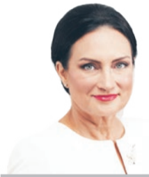
IZABELA KLOC, poseł Ziemi Mikołowskiej i przewodnicząca Sejmowej Komisji do Spraw Unii Europejskiej.

Im bliżej wyborów do Parlamentu Europejskiego tym rośnie temperatura dyskusji nad przyszłym kształtem wspólnoty. Co do tego, że zmiany są nieuniknione i konieczne, raczej nikt nie powinien mieć złudzeń. Wybory muszą dać odpowiedź na dwa fundamentalne pytania: czym dziś są unijne wartości i kto powinien stać na ich straży?