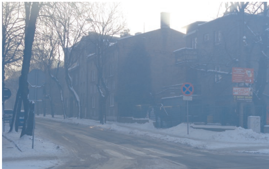
Smog mocno daje się we znaki mieszkańcom Mikolowa.