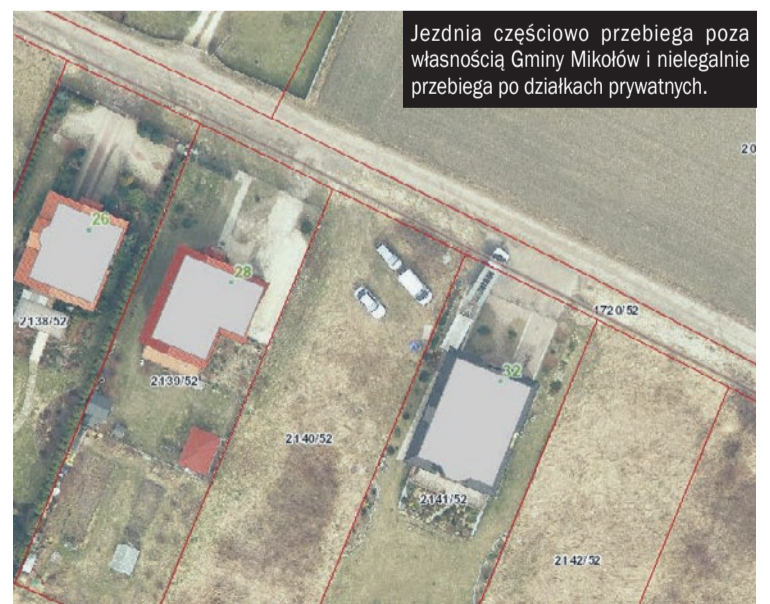
Jezdnia częściowo przebiega poza własnością Gminy Mikołów i nielegalnie przebiega po działkach prywatnych.