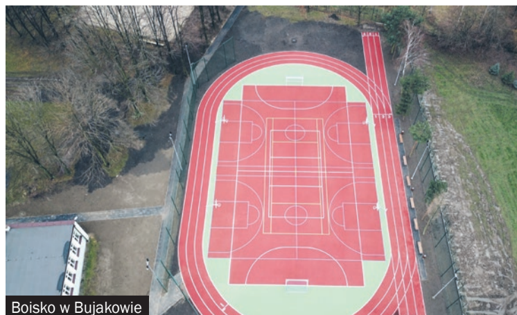
Boisko w Bujakowie

O co zatem Mikołów stał się bogatszy? W marcu otwarto boisko wielofunkcyjne w Bujakowie. Gdy na fejsbuku opublikowano pierwsze zdjęcia robione z drona, mieszkańcy pytali czy to wizualizacja czy faktyczny obiekt. Pod koniec roku podobne boisko zaczęto budować przy ul. Zielonej na Recie. Gdy tylko pogoda pozwoli, realizowane będą prace wykończeniowe.