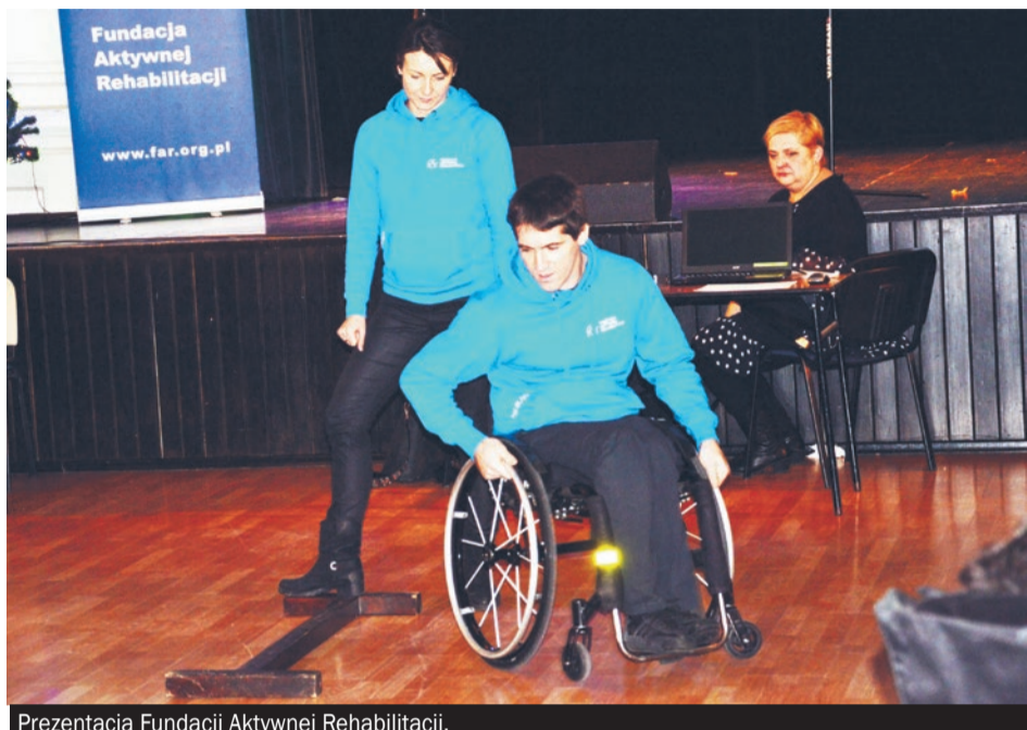
Prezentacja Fundacji Aktywnej Rehabilitacji.

13 grudnia w rocznicę podpisania Konwencji Praw Osób Niepełnosprawnych ONZ w mikołowskim domu kultury zorganizowano obchody Dnia Osób Niepełnosprawnych.