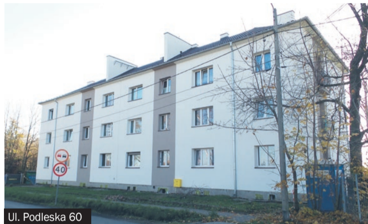
Ul. Podleska 60

nim roku do tej grupy dołączyły budynki przy Prusa 5, Podleskiej 60, Mickiewicza 24, rozpoczęła się także dłu-