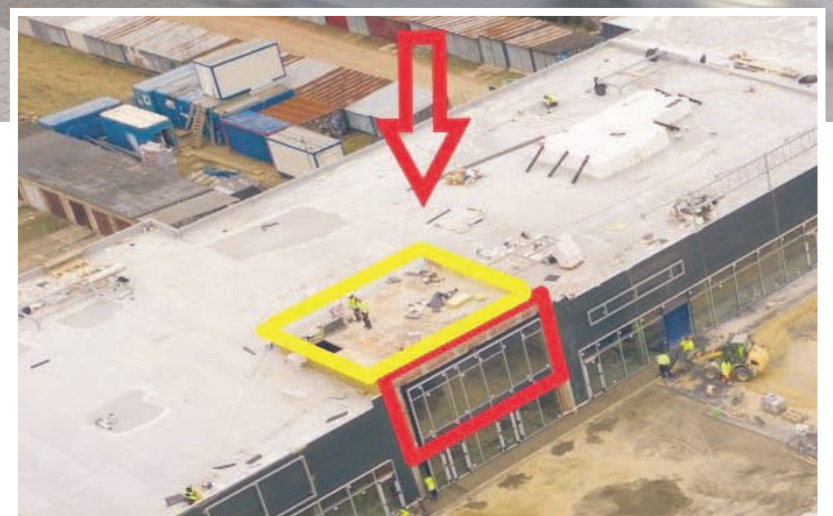
Roboty trwają, otwarcia możemy się spodziewać w najbliższych miesiącach.