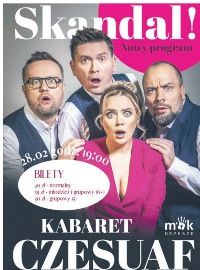
Sala Widowiskowa MOK Orzesze, ul. Fabryczna 1

Czesuaf to pierwsza liga polskiego kabaretu. Ekipa rozbawia publiczność już od 20 lat i nie zwalnia tempa. Po doskonałym przyjęciu przez widzów programie „Przyjęcie” czwórka Czesków rusza w Polskę z całkowicie nowym programem zatytułowanym „Skandal!”. Nowe historie, intrygujące postaci, nieoczekiwane rozwiązania, a to wszystko osadzone w naszej codziennej, nie zawsze łatwej rzeczywistości. Popatrzcie na otaczający świat oczami trzech przystojniaków z piękną i energiczną blondynką na czele. Dajcie się im wciągnąć w pełną zaangażowania podróż po skeczach i piosenkach, które każdemu gwarantują blisko dwie godziny doskonałej rozrywki na najwyższym poziomie. Pozwólcie się zaprosić do wspólnej, skandalicznie dobrej zabawy.