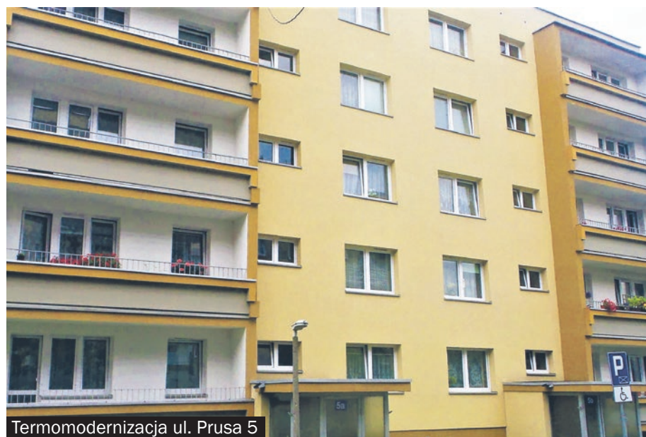
Termomodernizacja ul. Prusa 5