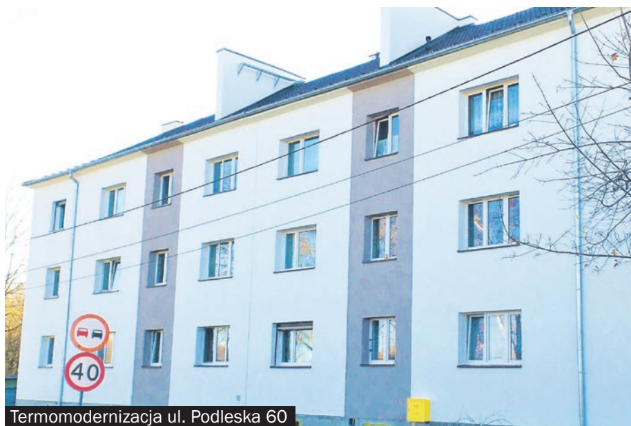
Termomodernizacja ul. Podleska 60

Inwestycje termomodernizacyjne kosztować mają łącznie ponad 5 mln złotych.