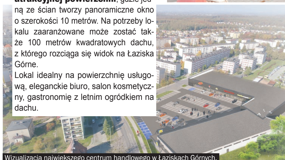
Wizualizacja największego centrum handlowego w Łaziskach Górnych.