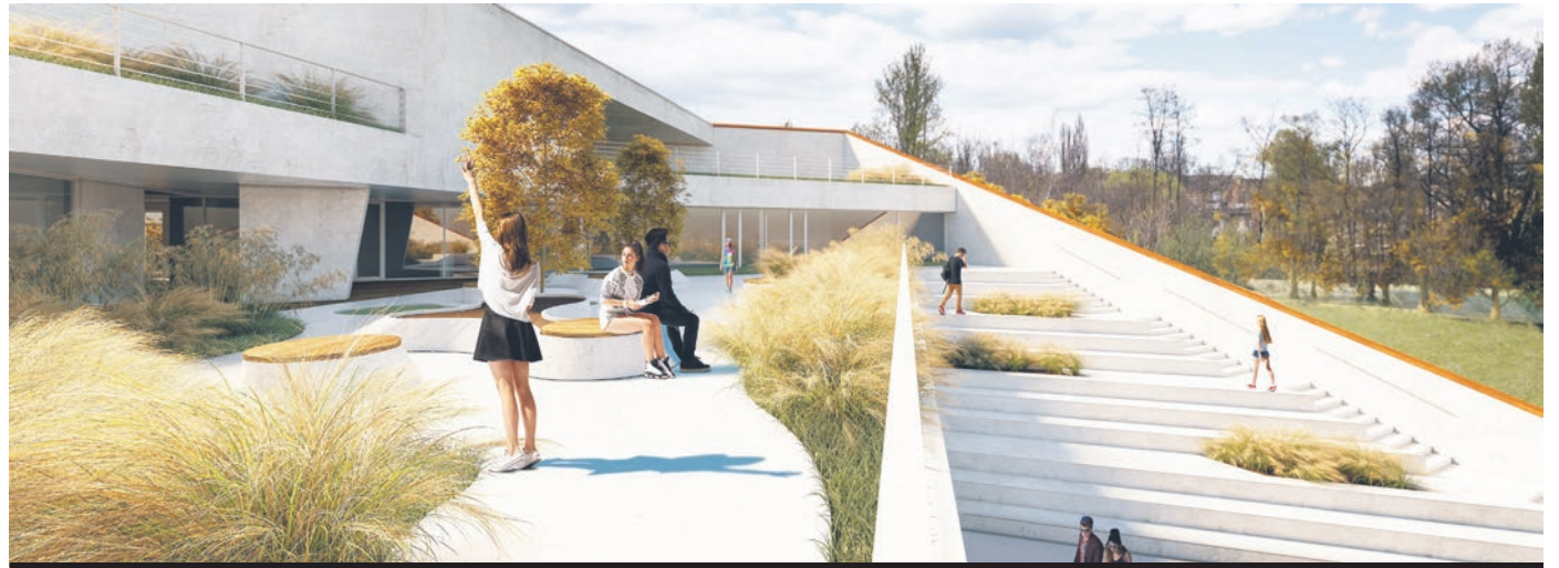
Z poprzedniej transzy rządowych pieniędzy dla naszego powiatu najbardziej spektakularną inwestycją jest budowa nowej siedziby Ogniska Pracy Pozaszkolnej.

► Rząd lada moment uruchomi kolejną transzę wsparcia inwestycyjnego dla samorządów. Nieoficjalnie wiemy, jaką ofertę dostanie powiat mikołowski.