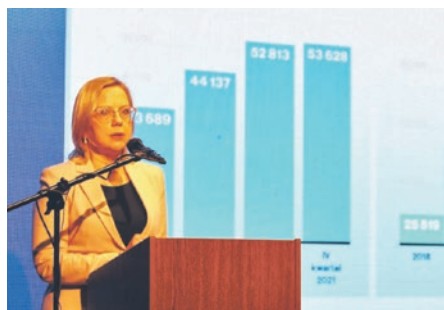
ANNA MOSKWA, minister Klimatu i Środowiska:

Nie przestajemy pracować nad nowymi rozwiązaniami w programie „Czyste Powietrze”. Zgodnie z obietnicami, z początkiem roku startujemy z nową częścią „Czystego Powietrza” dla najmniej zamożnych. Ale przed nami stoją też kolejne wyzwania: dostosowanie programu do korzystania ze środków unijnych, przegląd kosztów kwalifikowanych choćby pod kątem położenia większego nacisku na termomodernizację, która skutecznie przekłada się na oszczędności w zakresie efektywności energetycznej. Niebawem szansę na wymianę „kopciucha” z dotacją będą mieli również mieszkańcy budynków wielorodzinnych, dla których przygotowujemy nowy program o zasięgu ogólnopolskim.