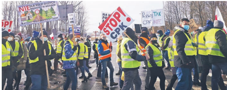
Mieszkańcy w protestach usiłują wymusić na rządzie zmianę trasy szybkiej kolei. Czy internetowe akcje burmistrza Mikołowa im w tym pomogą?

Z jednej strony niektórzy samorządowcy prowadzą poufne rozmowy z europoseł Izabelą Kloc, aby przekonać premiera Mateusza Morawieckiego do zmiany trasy szybkiej kolei. Jest też burmistrz Mikołowa, który na facebooku obwieszcza, że „jedynym sposobem na zakończenie tego szaleństwa jest upadek PiS”. To nie pomaga w negocjacjach z CPK i psuje efekt społecznych protestów.