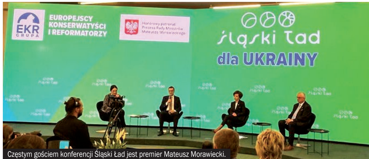
Čyęstym goęciem konferencji Śląski Ład jest premier Mateusz Morawiecki.