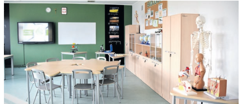
„Zielona Pracownia” w Szkole Podstawowej im. Bohaterów Września 1939 w Gostyni.

Już wkrótce w gminie może powstać kolejna nowoczesna szkolna pracownia multimedialna, a w rejonie Wicia - boisko do koszykówki.