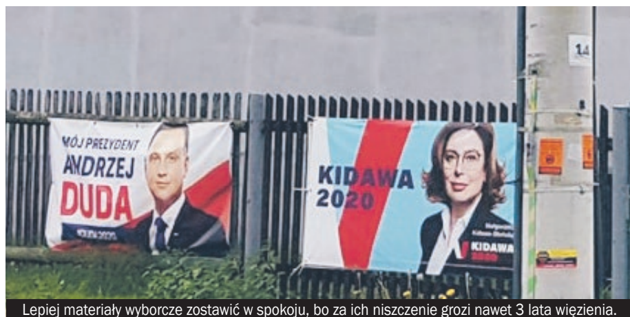
Lepiej materiały wyborcze zostawić w spokoju, bo za ich niszczenie grozi nawet 3 lata więzienia.