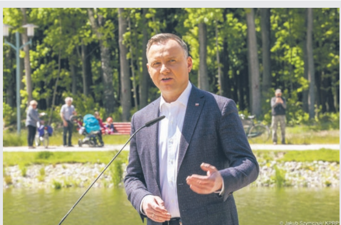
Prezydent RP ANDRZEJ DUDA:

Wszystkich do tego zachęcam, aby oprócz programu wielkiej retencji, średniej, budowy dużych i średnich zbiorników retencyjnych budować także tę retencję podstawową, przydomową. Krótko mówiąc zatrzymywać wodę gdzie się da, by płynęła wolniej, by powstała chwila, żeby była, nawadniała ziemię. Bo jest to dla nas przyszłość oraz naszego kraju i rolnictwa. Chcemy, by Polska była zielona, by Polska nie pustoszyła, by trawy były zielone przez najdłuższą część roku. Temu ma służyć poprawa stosunków wodnych. Każdy z nas może się do tego przyczynić przez przydomową retencję i zmianę przyzwyczajeń. Chciałbym, aby powstało jak najwięcej małych zbiorników wodnych.