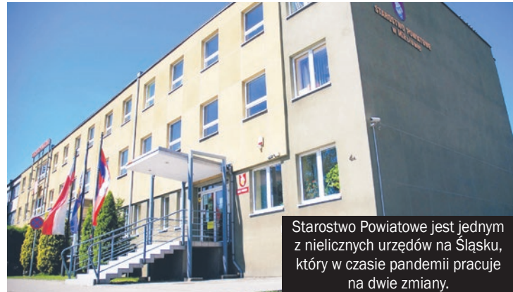
Starostwo Powiatowe jest jednym z nielicznych urzędów na Śląsku, który w czasie pandemii pracuje na dwie zmiany.

Do maja starostwo rozdysponowało 20 mln zł wsparcia z 35,5 milionów, które otrzymało w ramach tarczy antykryzysowej. Przedsiębiorcy mogą otrzymać za pośrednictwem PUP nisko oprocentowane pożyczki na pokrycie bieżących kosztów prowadzenia działalności gospodarczej. Te środki na pewno pomogą przetrwać trudny czas.