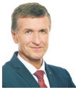
STANISŁAW PIECHULA, burmistrza Mikołowa

Zorganizowaliśmy akcję, w ramach której zwróciłem się z prośbą do darczyńców o przekazanie laptopów na rzecz uczniów. Na reakcję nie musieliśmy długo czekać.