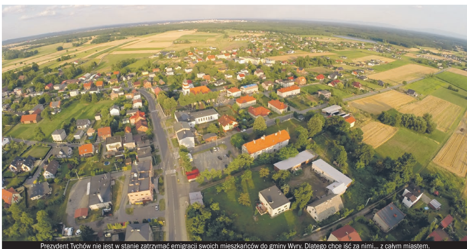
Prezydent Tychów nie jest w stanie zatrzymać emigracji swoich mieszkańców do gminy Wyr. Dlatego chce iść za nimi... z całym miastem.

Nie pierwszy i zapewne nie ostatni raz wraca pomysł przyłączenia Gostyni czy całej gminy Wyr do Tychów. Myślę, że główną przyczyną tego medialnego zamieszania jest sytuacja wewnętrzna tego miasta. Tychy mają coraz więcej problemów. Miasto się zamyka, zaczyna brakować terenów pod budownictwo mieszkaniowe. Wielu tyszan przeprowadza się do nas, do Wyr i Gostyni. Stąd pomysł integracji. Na pewno nie wyszlibyśmy na tym dobrze. Jestem przekonana, że jako część Tychów nie zdołalibyśmy tyle zrobić, ile udaje nam się, jako samodzielnej gminie. Na pewno spadłaby jakość usług socjalnych, jak choćby zapewnienie dzieciom opieki przedszkolnej.