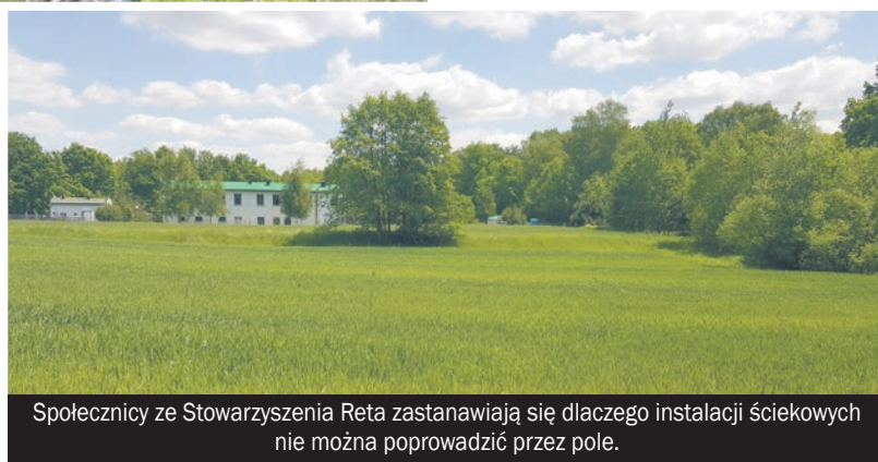
Spółcnicy ze Stowarzyszenia Reta zastanawiają się dlaczego instalacji ściekowych nie można poprowadzić przez pole.

brazowego Dolina Jamny. To jeden z najbardziej urokliwych zakątków nie tylko Mikołowa. Teraz spora jego część pójdzie pod topór, aby zrobić miejsce dla rur i osadników. W projekcie uchwały Rady Miasta znalazł się zapis, że przy realizacji tej inwestycji nie ma możliwości ominięcia Doliny. Innego zdania są społecznicy i wskazują na spore pole przed oczyszczalnią. Miasto ogłosiło konsultacje społeczne w tej sprawie. Stowarzyszenie Reta weźmie w nich udział z głosem sprzeciwu. Wrócimy do tej sprawy za miesiąc.