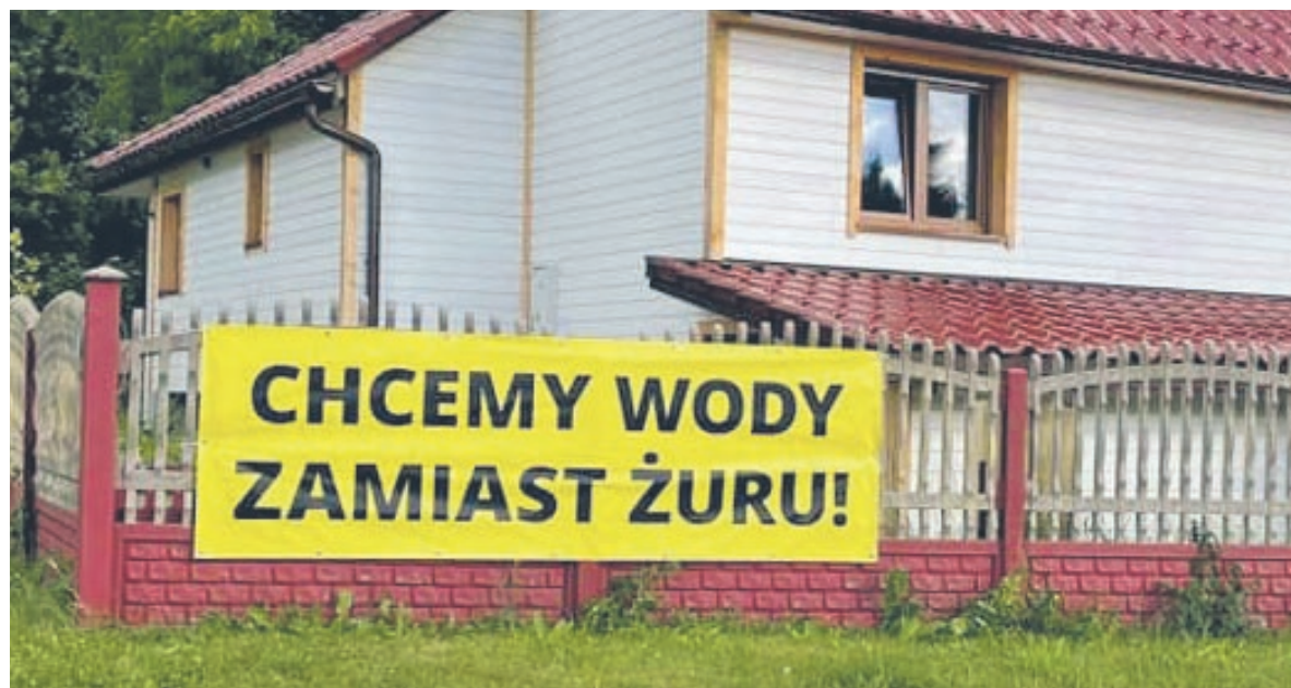
W Łędzinach przepięcie wody do podziemnego źródła w kopalni Ziemowit wywołało ogromną awanturę, w efekcie której RPWiK, PGG i władze miasta musiały wycofać się z tego projektu.

Łędzińskie portale społecznościowe zaroily się od alarmujących wpisów, że z kranów leci „żur”, a woda pozostawia osad, niszczący urządzenia AGD. W sieci zaroilo się od zdjęć brunatnej cieczy płynącej z kranów i pokrytych białym nalotem kielbasek, ugotowanych w kopalnianej wodzie. Wiatru w żagle nabrali opozycyjni samorządowcy, którzy nadali protestowi zorganizowane ramy i ściągnęli regionalne oraz ogólnopolskiej media, z programem interwencyjnym Polsatu na czele. Władze miasta, RPWiK i PGG słabo poradziły sobie komunikacyjnie z tym kryzysem. Burmistrz Łędzin udawała, że nic nie wiedziała o przepięciu wody, a przedstawiciel spółki wodociągowej udawał, że z wodą wszystko jest w porządku. W efekcie, po kilku miesiącach zamieszania, nerwów, protestów, pikiet, obrzucania się w mediach oskarżeniami, w tym roku Łędziny zrezygnowały z kopalnianej wody i wróciły do GPW.