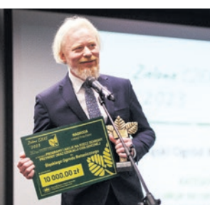
„Zielony Czek” dla Śląskiego Ogrodu Botanicznego. str. 20