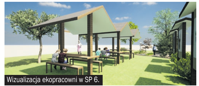
Wizualizacja ekopracowni w SP 6.

i Gospodarki Wodnej w Katowicach „Ekopracownia pod chmurką”. Zielona Przystań przy Piątce zostanie dofinansowana w kwocie: 69 571,20 zł, natomiast Leśna ostoja przy SP 6 otrzyma wsparcie w wysokości 65 360,66 zł.