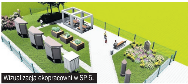
Wizualizacja ekopracowni w SP 5.

Szkoła Podstawowa nr 5 im. Powstańców Śląskich oraz Szkoła Podstawowa nr 6 im. Jana Pawła II z Oddziałami Integracyjnymi zostały laureatami konkursu ogłoszonego przez Wojewódzki Fundusz Ochrony Środowiska