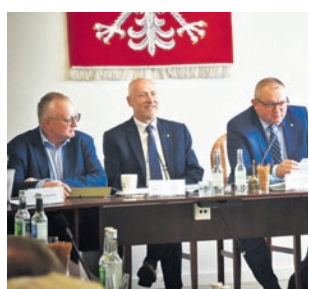
Uradzili, że starosta jest OK. str. 5