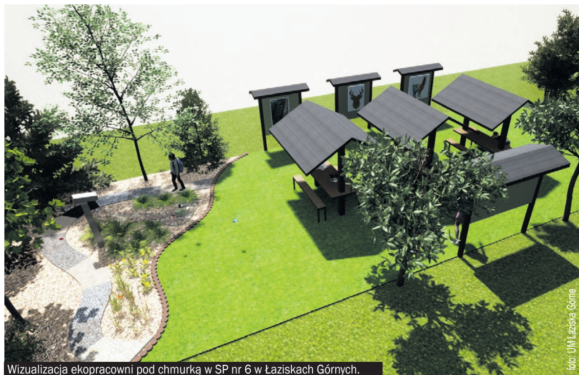
Wizualizacja ekopracowni pod chmurką w SP nr 6 w Łaziskach Górnych.

Na konkurs wpłynęło 151 wniosków. Celem konkursu było dofinansowanie zadań dotyczących utworzenia na terenie należącym do placówek oświatowych przestrzeni do prowadzenia zajęć dydaktycznych z zakresu przyrody, biologii, ekologii, geografii, geologii itp. w szkołach podstawowych oraz szkołach średnich województwa śląskiego. Maksymalna kwota dofinansowania to 70 tys. zł.