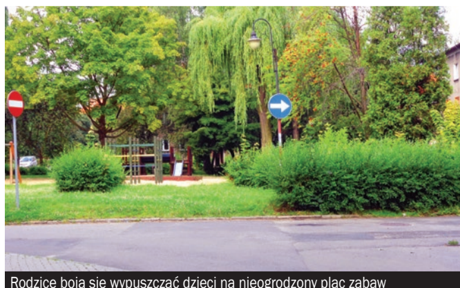
Rodzice boją się wypuszczać dzieci na nieogrodzony plac zabaw