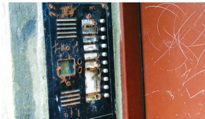
Lokatorzy bloku nr 8 płacą 744 zł czynszu, a nie mogą doprosić się sprawnego domofonu