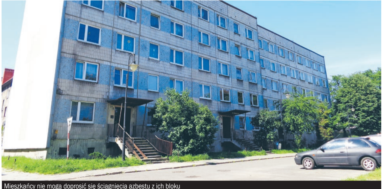
Mieszkańcy nie mogą doprosić się ściągnięcia azbestu z ich bloku