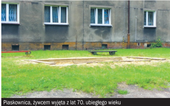
Piaskownica, żywcem wyjęta z lat 70. ubiegłego wieku