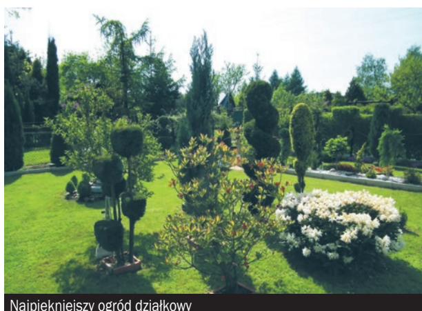
Najpiękniejszy ogród działkowy