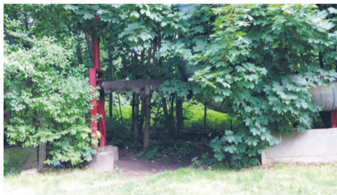
Zarośnięte chaszczami, nieoznakowane i niebezpieczne przejście przez tory