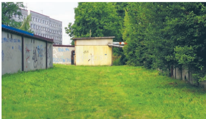
Zagajnik na obrzeżu osiedla służy bezdomnym jako noclegownia pod chmurką