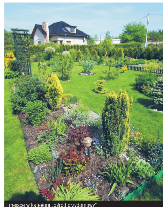
I miejsce w kategorii „ogród przydomowy”