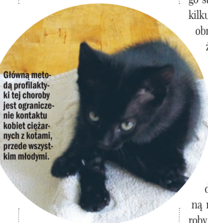
Główną metodą profilaktyki tej choroby jest ograniczenie kontaktu kobiet ciężarnych z kotami, przede wszystkim młodymi.

ale prawdopodobnie nie wywołuje u nich objawów chorobowych. Ostatecznym żywicielem dla tego pasożyta jest kot domowy. Tylko w organizmach kotów, w ich przewodach pokarmowych, może powstać taka forma rozwojowa Toxoplazmy, którą może zarazić człowieka. Pierwotniaki dostają się do organizmu człowieka drogą pokarmową, przenikając przez ścianę jelita do układu krążenia i ata-