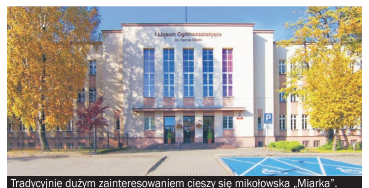
Tradycyjnie dużym zainteresowaniem cieszy się mikołowska „Miarka”.

- Do tej pory w latach ubiegłych władze Powiatu Mikołowskiego zatwierdza-