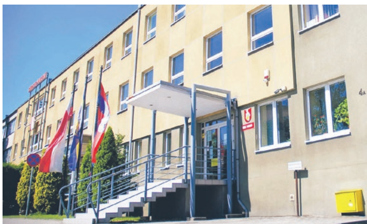
Ustawa „uwłaszczeniowa” choć szlachetna w intencjach przez wady prawne sprawia sporo problemów samorządom, w tym starostwom powiatowym.

Okazało się, że ustawa „uwłaszczeniowa” zawiera sporo prawnych niedoróbek, które wyszły na jaw, kiedy przepisy zaczęły już obowiązywać.