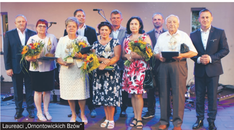
Laureaci „Ornontowickich Bzów”

► 29 czerwca - cóż to był za dzień! Cały Park Gminny w Ornontowicach przepelniony był radością i zabawą. Z każdej strony można było podziwiać fantastycznych artystów, szrudlarzy, animatorów, garncarzy i wiele innych zaangażowanych osób.