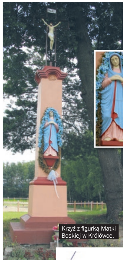
Krzyż z figurką Matki Boskiej w Królówce.