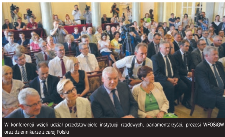
W konferencji wzięli udział przedstawiciele instytucji rządowych, parlamentarzysty, prezesi WFOŚiGW oraz dziennikarze z całej Polski