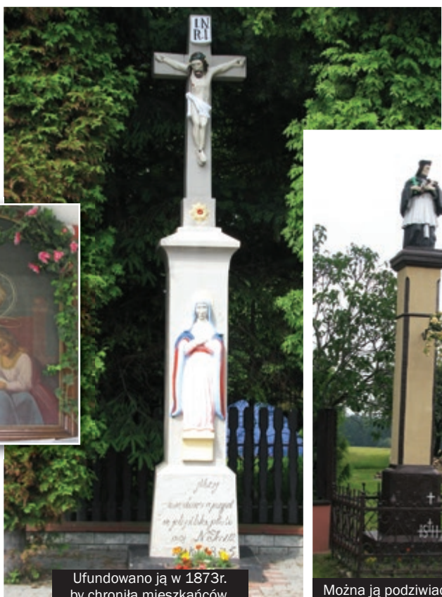
Ufundowano ją w 1873r. by chroniła mieszkańców.