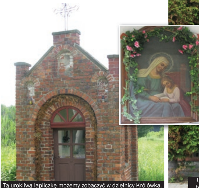
Tą urokliwą lopiczkę możemy zobaczyć w dzielnicy Królówka.