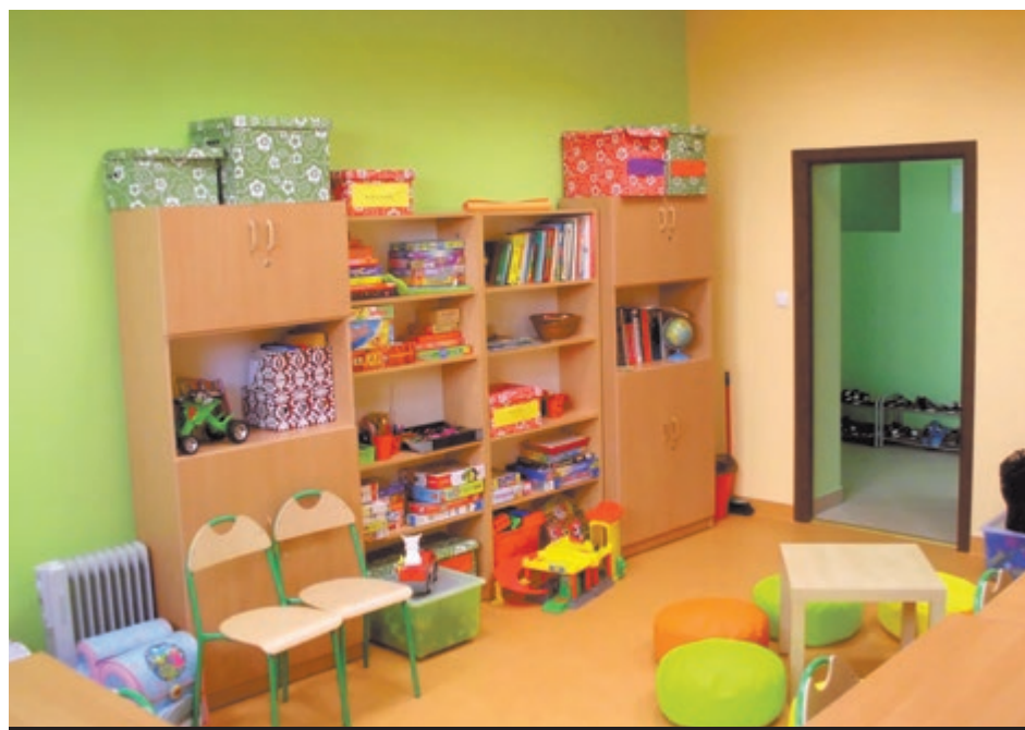
Odnowione pomieszczenia czekają na podopiecznych MOWRID

Od wielu lat filia ośrodka zajmowała pomieszczenia przy łaziskiej parafii pw. M.B. Królowej Różańca Świętego. Teraz, dzięki determinacji i życzliwości władz miasta – 20 dzieci może cieszyć się ładnymi, kolorowymi salami w nowym miejscu. Wychowankowie, podzieleni na dwie grupy wychowawcze, będą uczęszczać w czasie roku szkolnego do placówki od poniedziałku do piątku w godz. 14.00 - 18.00, obecnie - ciesząc się wakacjami - korzystają z zajęć w godz. od 9.00 do 13.00. Wyremontowane i wyposażone pomieszczenia dają poczucie ciepła i bezpieczeństwa, wnoszą optymistyczny nastrój oraz dają energię do wielu konstruktywnych zajęć.