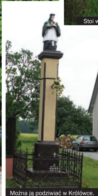
Można ją podziwiać w Królówce.