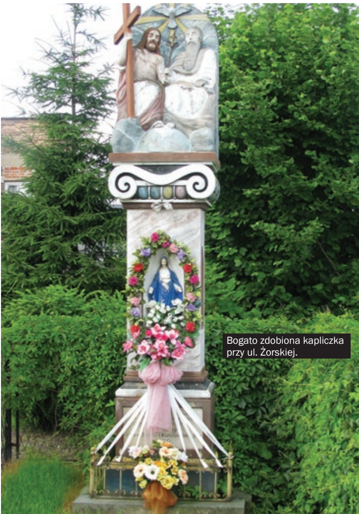
Bogato zdobiona kapliczka przy ul. Żorskiej.

ale znakomitą studium na temat śląskiej tożsamości kulturowej, której fundamentem jest przywiązanie do zasad i wartości. W tej publikacji znalazło się miejsce dla 17 kapliczek i krzyży. Ale na tym nie koniec. Chcemy kontynuować ten cykl, ale bez pomocy Państwa się nie obejdzie. Czekamy na sygnały o krzyżach i kapliczkach, nie tylko leżących wzdłuż dróg Orzesza, ale całego powiatu mikołowskiego. Być może z tych publikacji urodzi się w przyszłości coś większego, niż tylko artykuły w „Naszej Gazecie”. (fil)