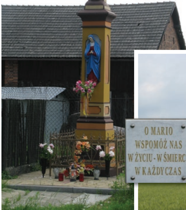
Opiekują się mieszkańcami Zazdrości od 1883r.