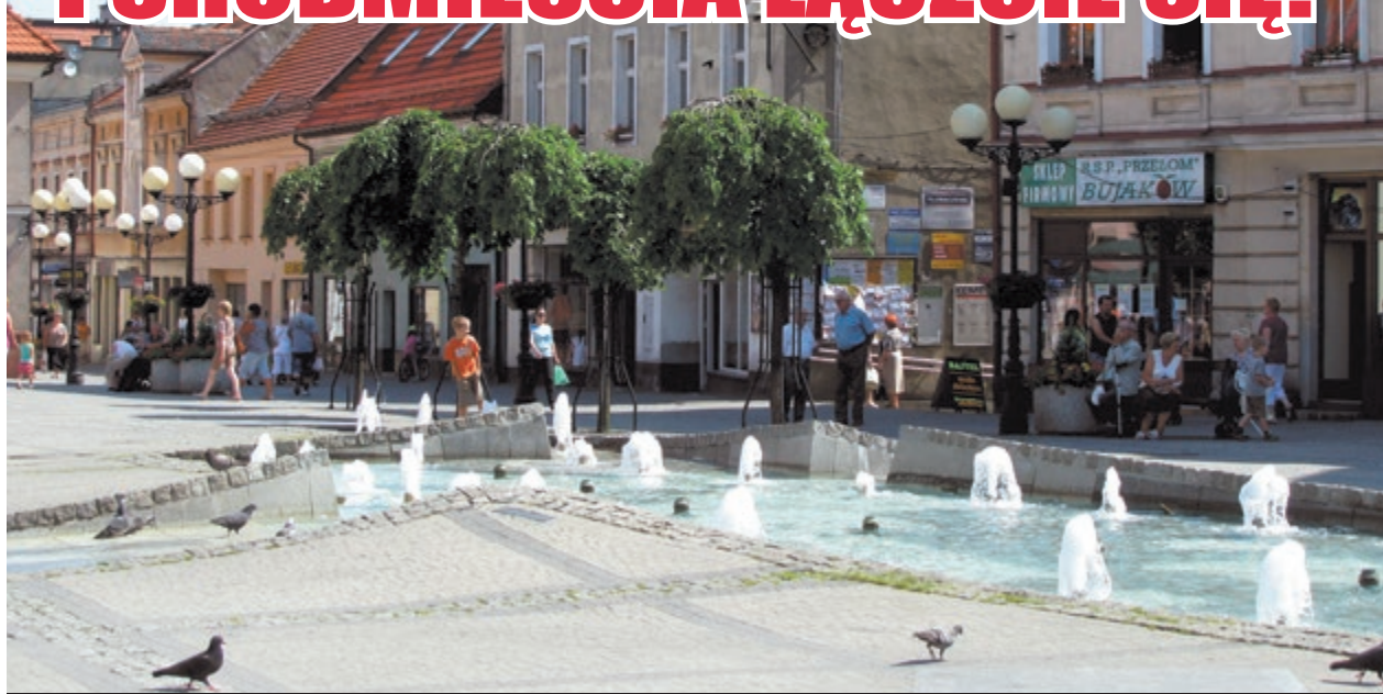
Rynek to doskonałe miejsce na spacer, zakupy czy załatwienie sprawy urzędowej.

Na łamach „Naszej Gazety” pragniemy zwrócić uwagę mieszkańcom miasta i powiatu na potrzebę dbałości o przestrzeń miejską. Nie chcemy, by lekko podchmieleni, nieświeży panowie koczowali na ławkach wyludzając od starszych osób drobne na piwo.