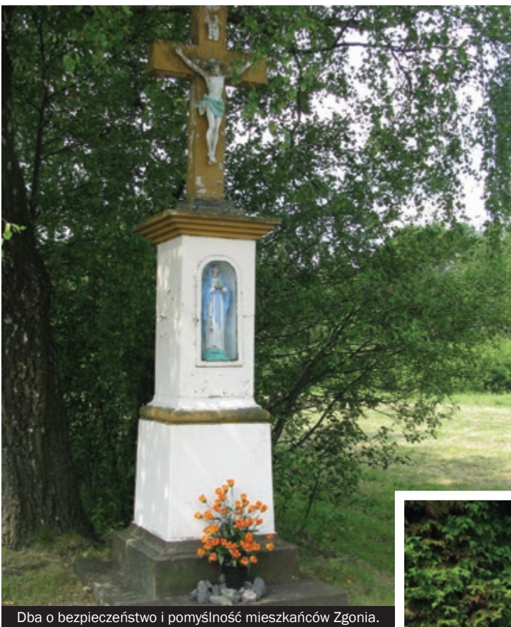
Dbą o bezpieczeństwo i pomyślność mieszkańców Zgonia.