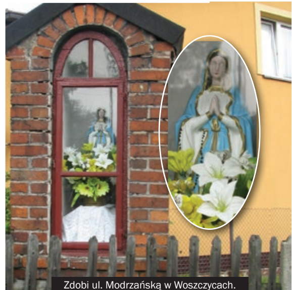
Zdobi ul. Modrzańską w Woszczykach.