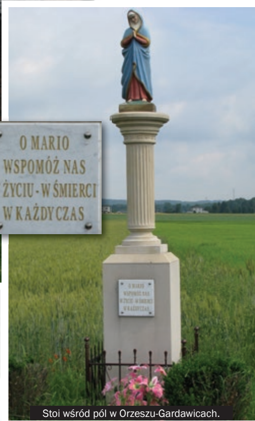
Stoi wśród pól w Orzeszu-Gardawicach.