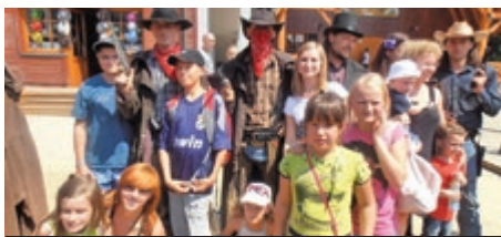
Podopieczni domu dziecka na wycieczce.

W powiecie mikołowskim funkcjonują obecnie 124 rodziny zastępcze, w których przebywa 223 dzieci. Trzy z nich pełnią rolę pogotowia rodzinnego. To znaczy, że w każdej chwili może do nich trafić dziecko, które wymaga natychmiastowej opieki. Zazwyczaj dzieje się to w dramatycznych okolicznościach. Rodzice porzucają dzieci, albo ze względu na alkohol i przemoc domową, tracą do nich prawa. Kilka miesięcy temu pisaliśmy o dziecku porzuconym w oknie życia w Borowej Wsi. Na szczęście dziewczynce nic się nie stało. Cała i zdrowa trafiła do pogotowia rodzinnego.