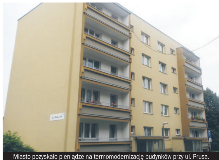
Miasto pozyskało pieniądze na termomodernizację budynków przy ul. Prusa.