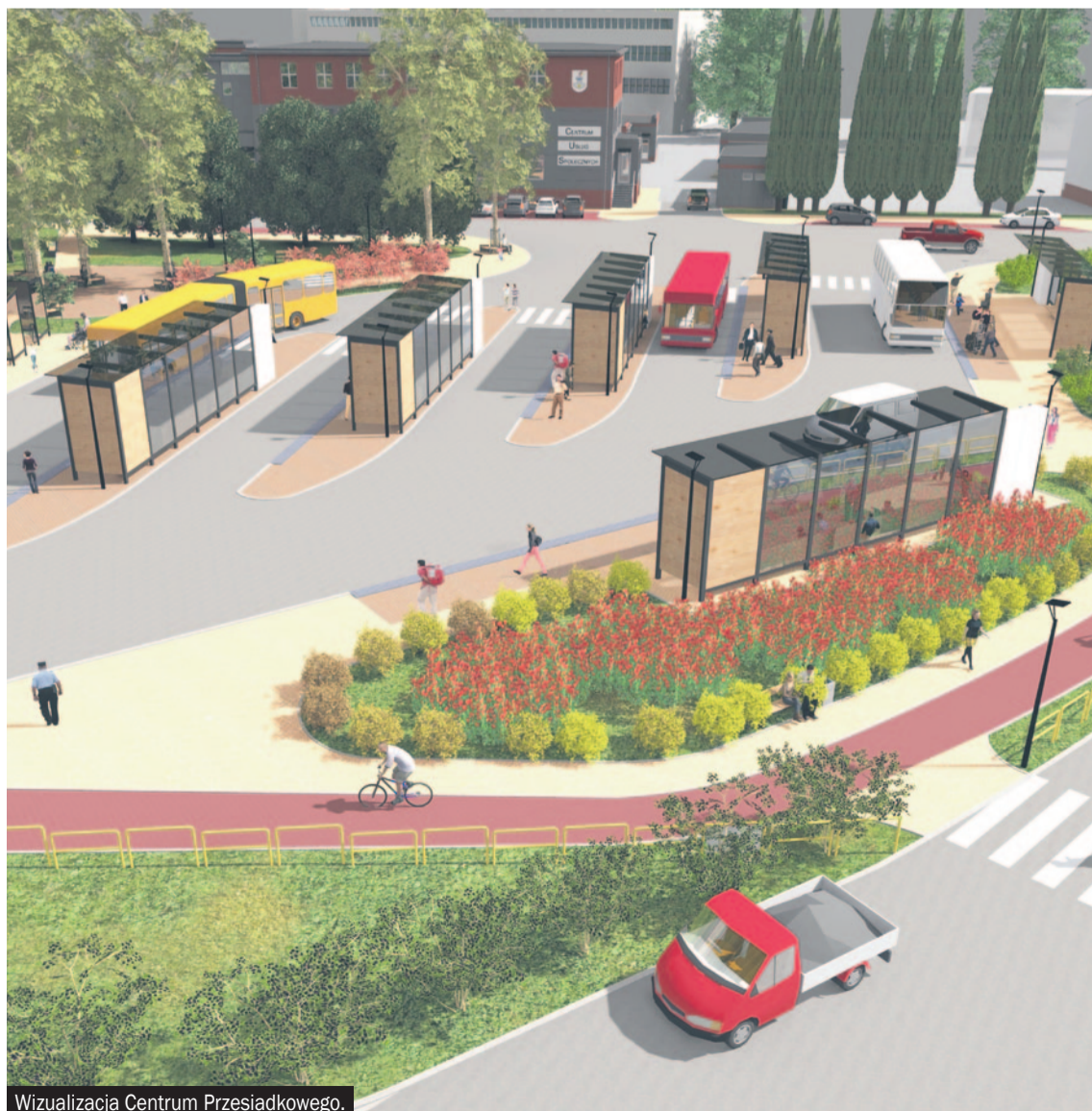
Wizualizacja Centrum Przesiadkowego.

- Kibicuję władzom Mikołowa i innym samorządom naszego powiatu w walce o unijne pieniądze. Wiem, jak duża jest konkurencja. Centrum przesiadkowe będzie wizytówką całego powiatu. Gratuluję!