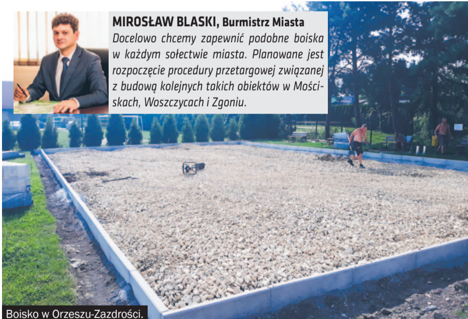
Boisko w Orzeszu-Zazdrości.