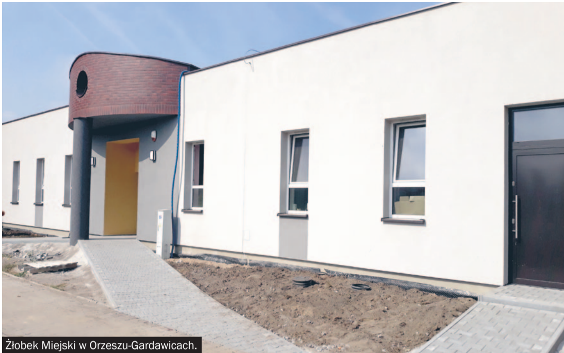
Żłobek Miejski w Orzeszu-Gardawicach.