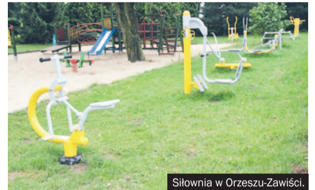
Siłownia w Orzeszu-Zawiści.

Przy ul. Skośnej w Orzeszu, obok siłowni plenerowej powstał nowy plac zabaw, na który mieszkańcy tamtej okolicy z niecierpliwością czekali. W Orze-