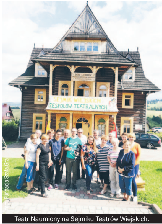
Teatr Naumiony na Sejmiku Teatrów Wiejskich.