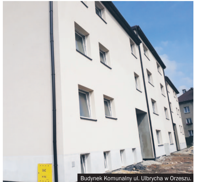
Budynek Komunalny ul. Ulbrycha w Orzeszu.