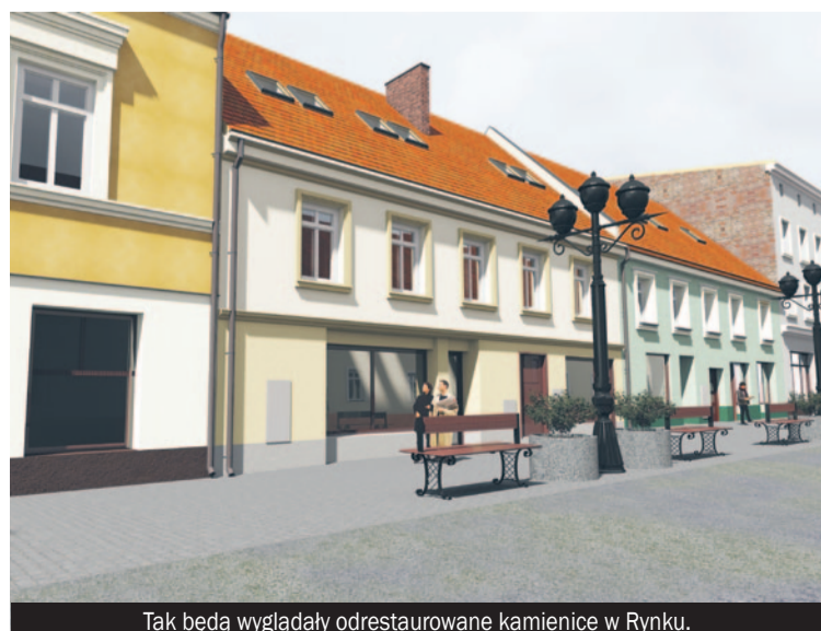
Tak będą wyglądały odrestaurowane kamienice w Ryнку.