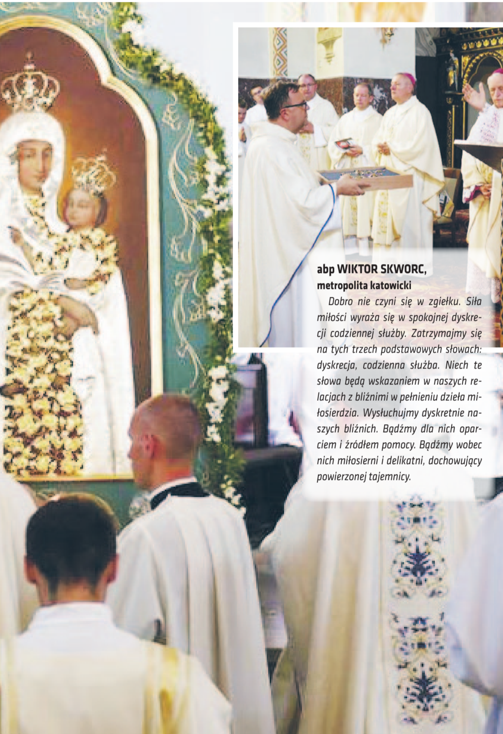
abp WIKTOR SKWORC, metropolita katowicki

skiej spełniła oczekiwania i marzenia wiernych, którzy ylice św. Wojciecha, aby wziąć udział w uroczystościach, jeszcze wymiar praktyczny. Otworzyły się nowe możliwości powiatu. Czy samorządowcy wykorzystają tę szansę?