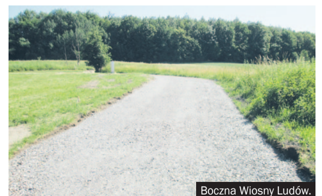
Boczna Wiosny Ludów.

W tym samym okresie zaplanowano także rozpoczęcie remontu odcinka bocznego ul. Gliwickiej w Orzeszu oraz przebudowę ul. Reymonta w Orzeszu.