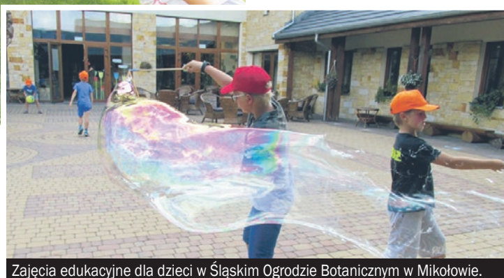
Zajęcia edukacyjne dla dzieci w Śląskim Ogródku Botanicznym w Mikołowie.

■ Stowarzyszenie Ziemia Zdegradowana Przywrócona Życiu w Rogoźniku warsztaty mają na celu zapoznanie się uczniów z przyrodą Wyżyny Krakowsko-Częstochowskiej i wskazanie jej wartości, przebiegu sukcesji ekologicznej, zachodzących zja-