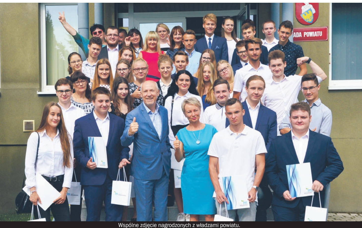
Wspólne zdjęcie nagrodzonych z władzami powiatu.