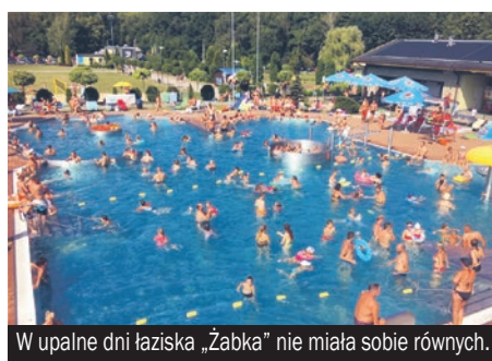
W upalne dni łaziska „Żabka” nie miała sobie równych.

Rolki, wycieczki, kąpiele, spacer, odpoczynek w wakacyjnym słońcu... To już za nami. Wakacyjna rekreacja zakończyła kolorową fetę przed Miejskim Domem Kultury w Łaziskach Górnych.