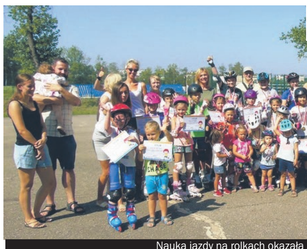
Nauka jazdy na rolkach okazała się hitem wakacji.