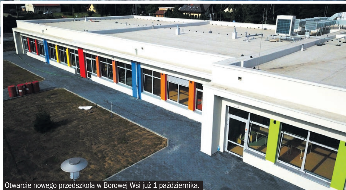
Otwarcie nowego przedszkola w Borowej Wsi już 1 października.

Likwidacja gimnazjów i przeniesienie dwóch roczników uczniów do i tak już mniejszych szkół w sołectwach (powrót do szkół 8-klasowych), mocno zaburzyły uporządkowane funkcjonowanie mikołowskiej oświaty i spowodowały konieczne i drogie inwestycje w rozbudowę szkół sołeckich. Silny wpływ ma także wzrost liczby dzieci w sołectwach wynikający z napływu nowych