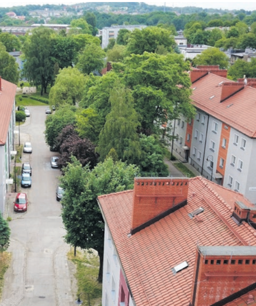
ickiewicza 25 mln zł