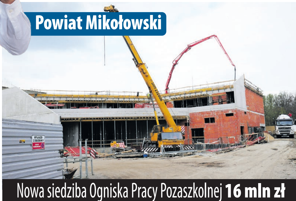
Nowa siedziba Ogniska Pracy Pozaszkolnej 16 mln zł