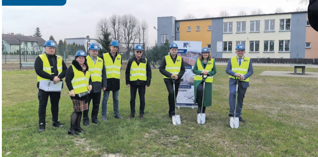
Nowe przedszkole przy SP nr 6 12,7 mln zł