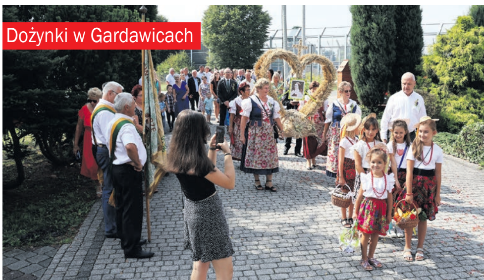
Dożynki w Gardawicach

Relacja zdjęciowa z dożynek znajduje się na Facebooku Gazety Orzeskiej.