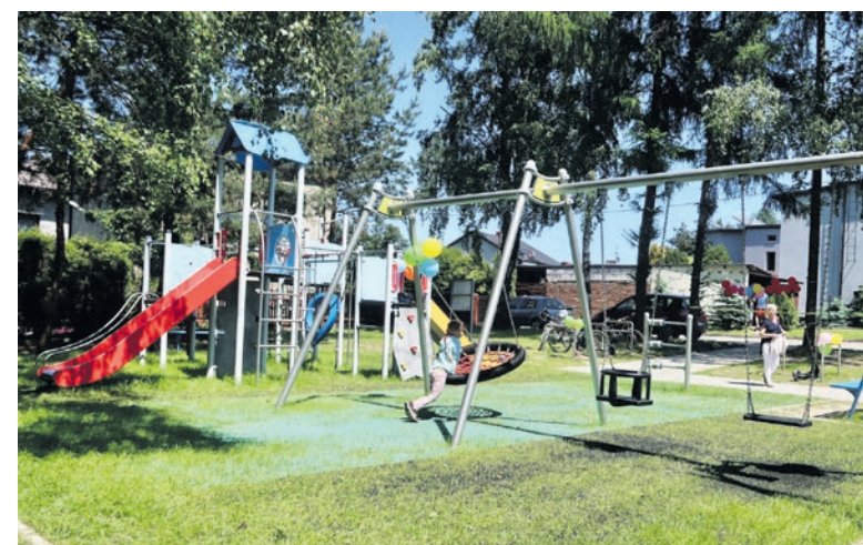
Infrastruktura sportowo-rekreacyjna dla dzieci to jedno z najczęściej składanych wniosków do BO.

Chęć skorzystania z głosowania mobilnego należy zgłosić telefonicznie (nr tel. 32 32 48 467) do poniedziałku 18.09 do godz. 17:00.