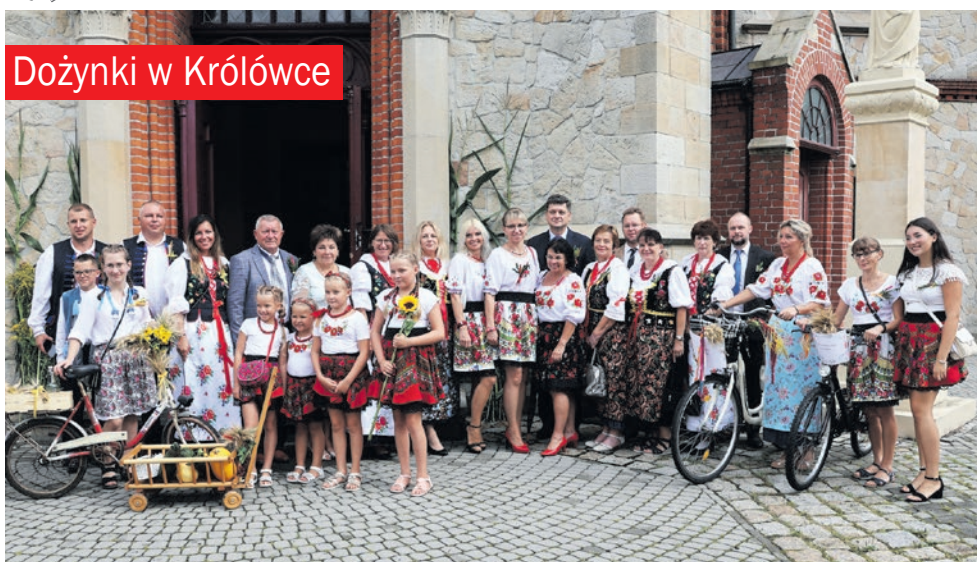
Dożynki w Królówce