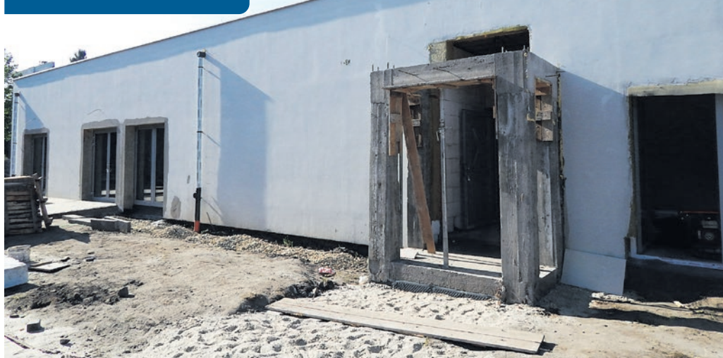
Budowa żłobka 3,5 mln zł