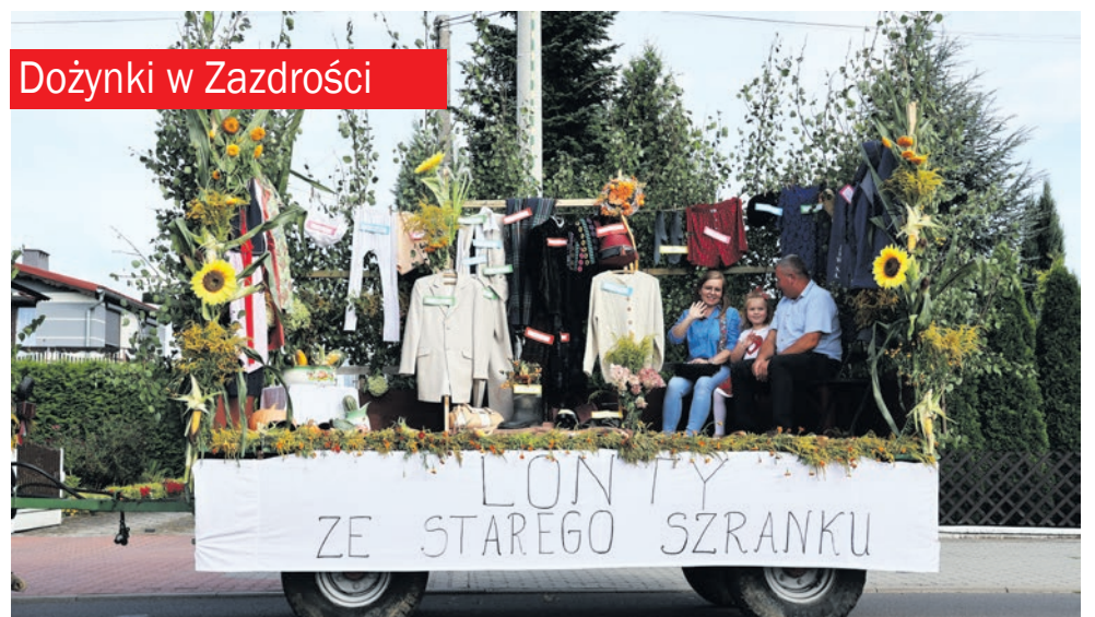
Dożynki w Zazdrości