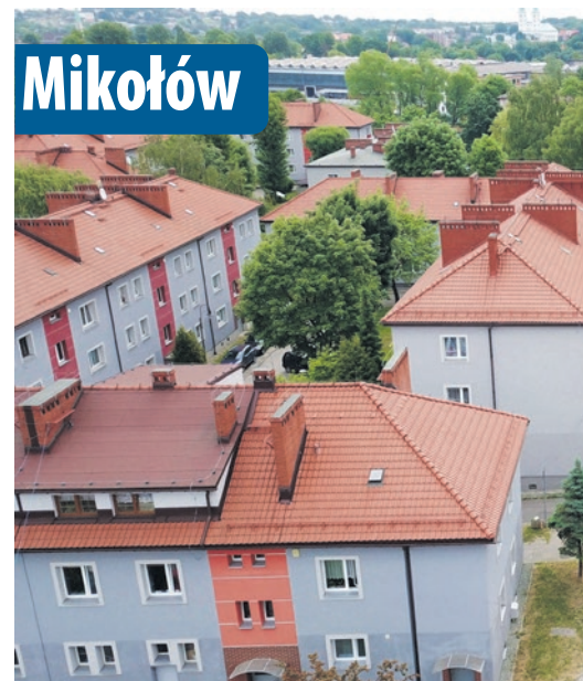
Rewitalizacja osiedla M