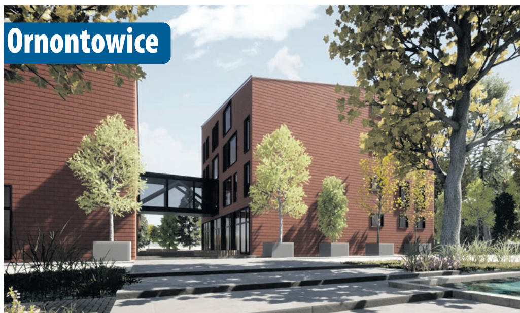
Utworzenie centrum kulturalnego 5 mln zł