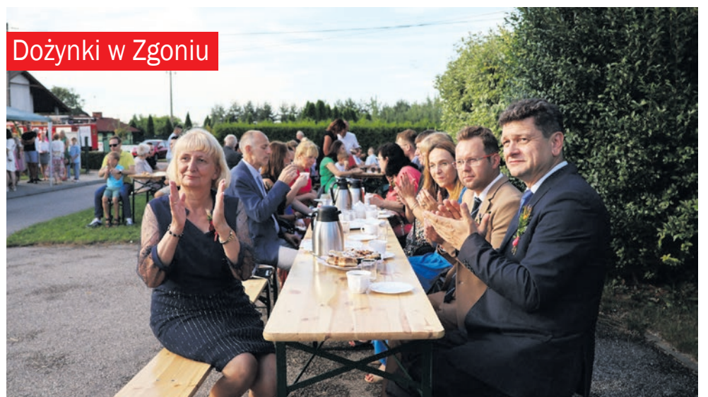
Dożynki w Zgoniu