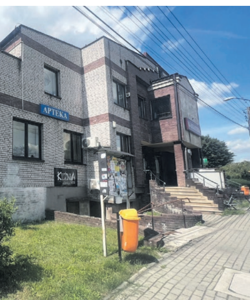
ku biblioteki 4,9 mln zł