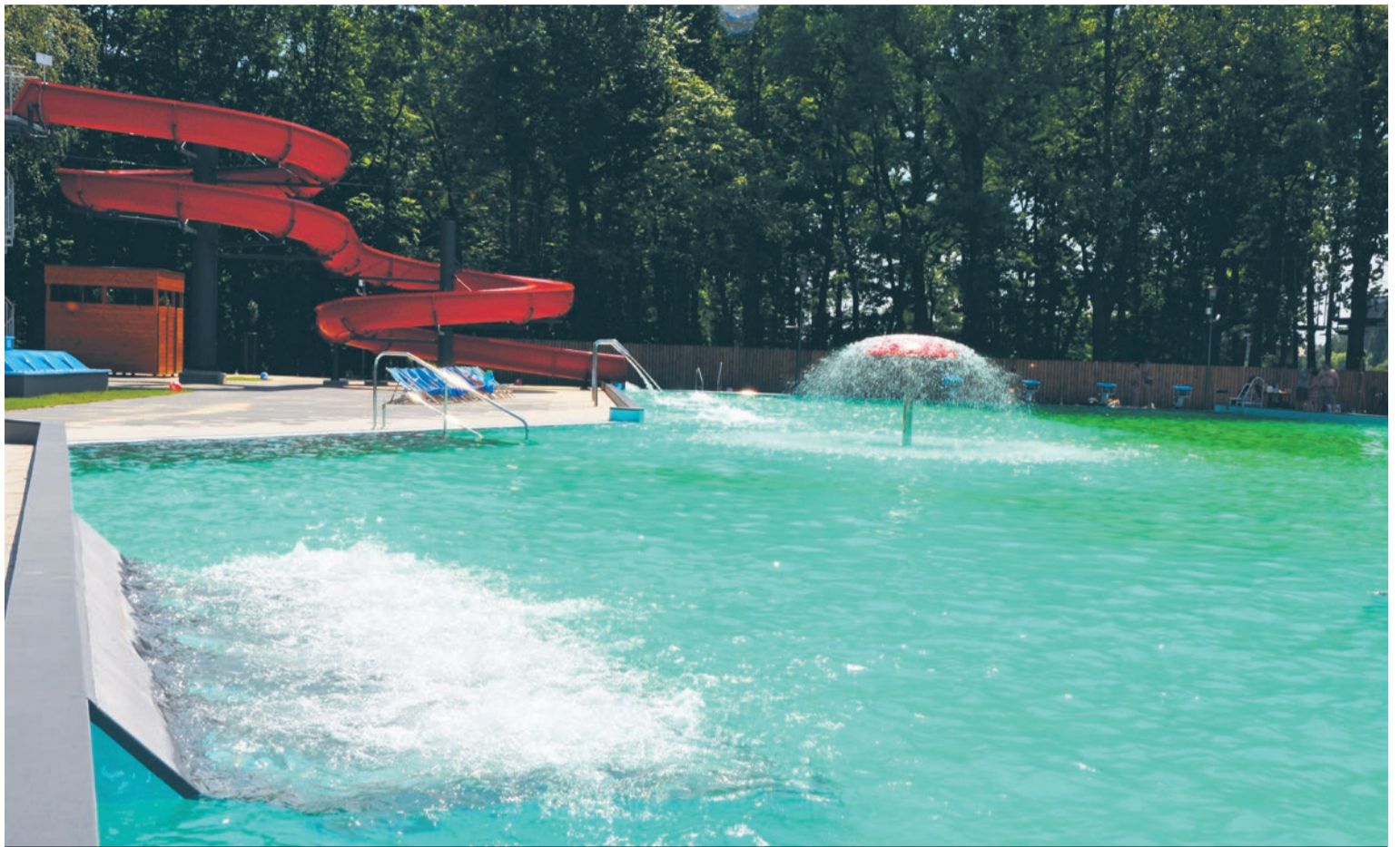
W Świętochłowicach, dzięki środkom unijnym, zbudowano jeden z najnowocześniejszych basenów w Polsce. Ruda Śląska nie otrzymała unijnej dotacji na remont kąpieliska w Nowym Bytomiu.