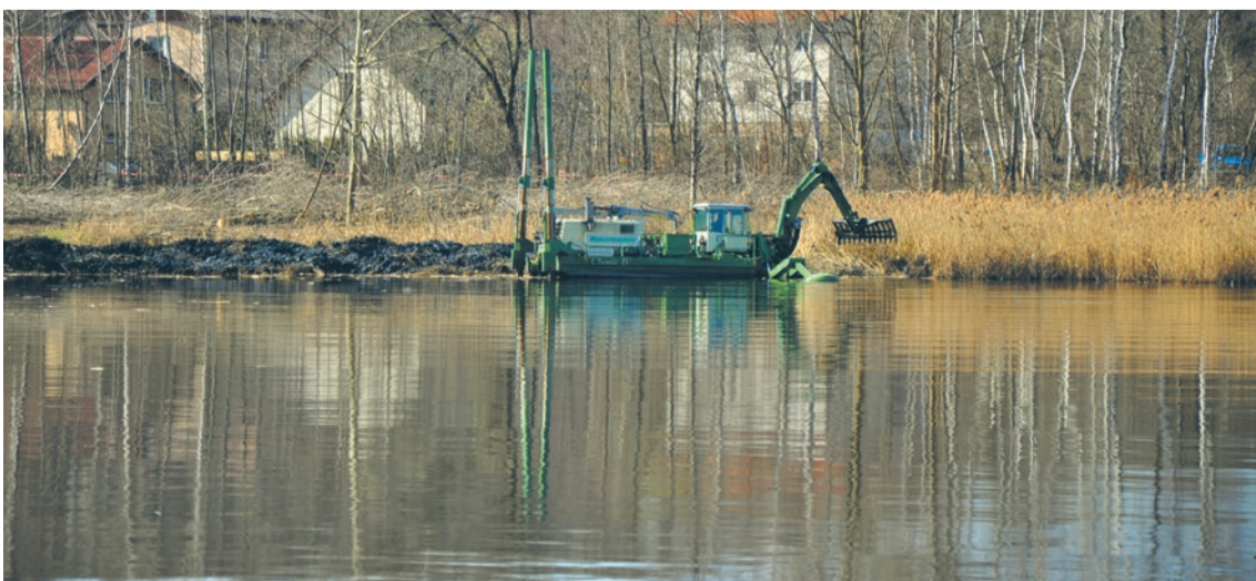
Dzięki środkom unijnym trwa rewitalizacja stawu Kalina. W Rudzie Śląskiej jest wiele ekologicznie zdegradowanych terenów, o których nikt nie chce pamiętać.